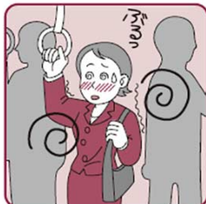
体力が消耗している時に