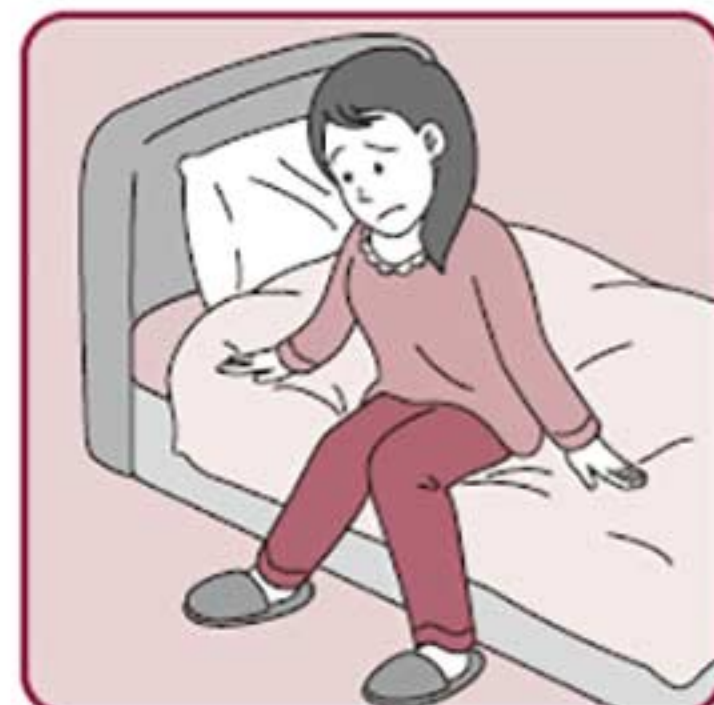
カフェインが気になる が疲れを感じる時に